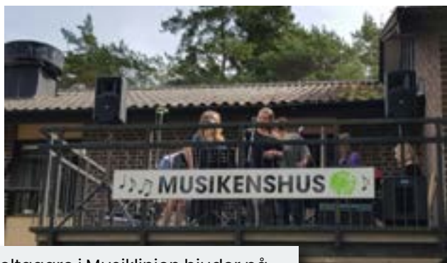
Deltagare i Musiklinjen bjuder på konsert från Musikens hus balkong.

Sedan handlade det om att få till ett bra kollegium och då var det i den närmaste omgivningen, vänner från Musikhögskolan bland annat, som han hittade sina medarbetare.