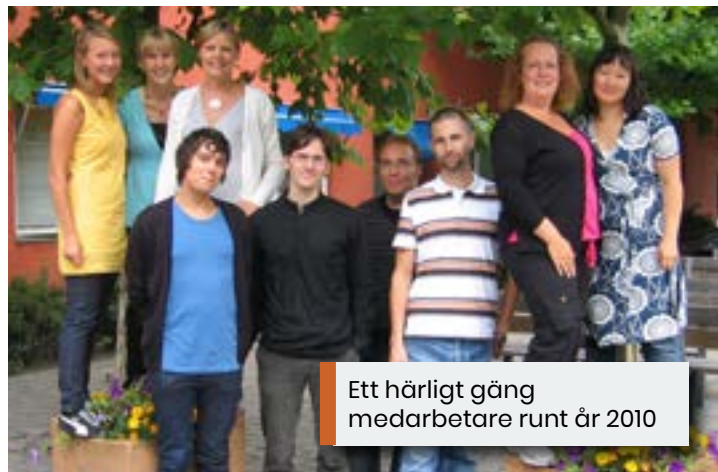
Ett härligt gäng medarbetare runt år 2010

Öppettider: Tisdagar kl. 10.00-15.00 Torsdagar kl. 10.00-15.00